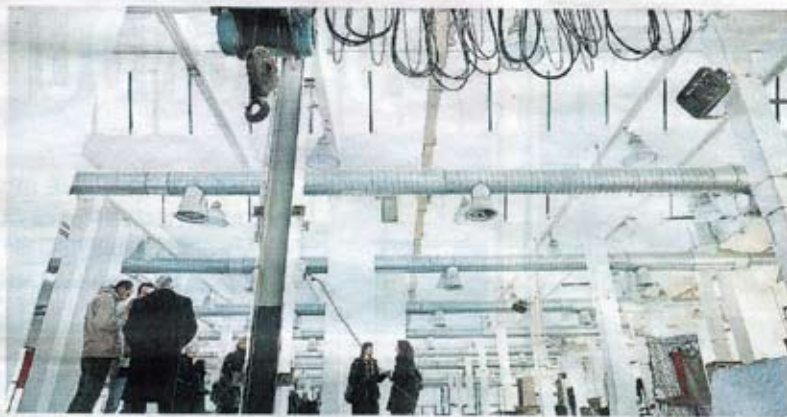
Laboratorio Una veduta dei capannoni e una creazione di moda etica per Made in Mage