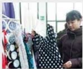
Made in Mage

Sesto San Giovanni, 23 gennaio 2011 - Sono giovani, hanno talento e amano giocare con i materiali di recupero o con oggetti che mai penseremmo di indossare. Bottoni, legno, plastica, lattine, feltrini, corde. Ci fanno di tutto: borse, bracciali, ciabatte, vestiti. Chi ieri pomeriggio ha partecipato all'inaugurazione del Mage non poteva che saltare da uno stand all'altro come una pallina da ping pong.